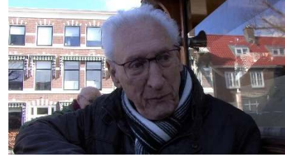
Drie 'ondervoede kinderen' van 75 jaar geleden uit: 'De terugkeer van de BONA SPES'